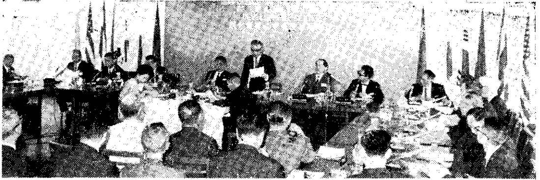
亞洲蔬菜發展中心，籌備會議在臺北舉行。