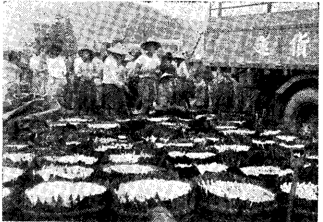
魚貨完成拍賣，等待運離魚市場

魚市場所收取的管理費，有二種用途：一是魚市場本身的經營費用，包括員工薪津、郵電費、交通費、市場設備擴張及改善之經費。如有盈餘時，則可經政府核准，用於漁業改進及推廣。