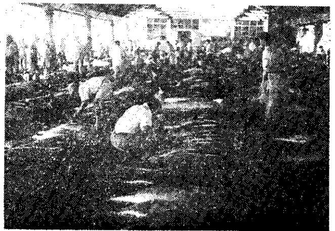
魚管整齊地排在拍賣場內等待拍賣

。比 如臺 北市 ，除 中央 魚市 場外 ，政 府特 准生 產者 團體 組織 一個 示範 魚市 場， 那就 是太 原路 魚市 場。