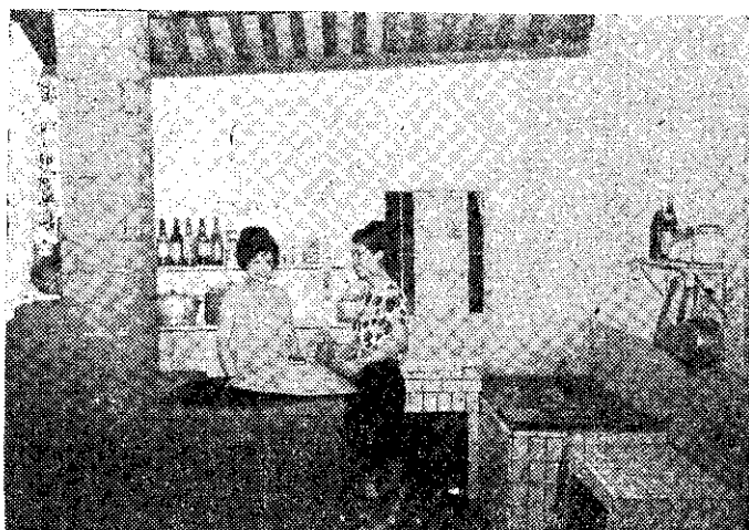
(環國誌)! 適行生衛，潔整房廚