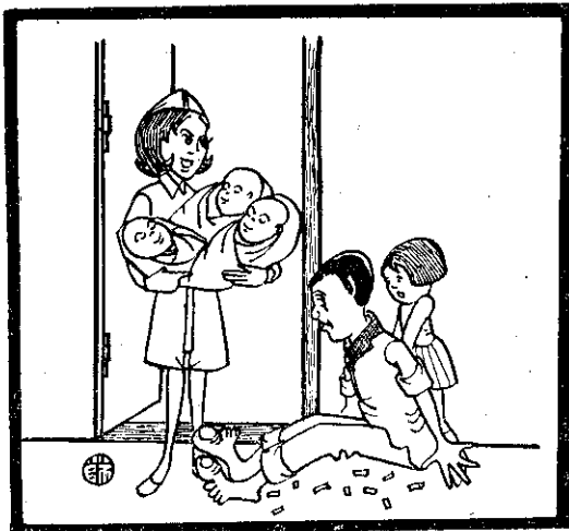
(賢聰詳)！喜恭！喜恭！喜恭