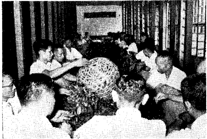
(攝德坤林) 業作機潤姜母觀員人術技業茶