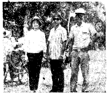
泰國暹羅大使與十南會員(沈)

高雄縣四健會五十七年度縣露營大會，自十月十六日起為期四天，在澄清湖畔舉行，全縣各鄉鎮及農校均選派代表參加，大會節目有公民測驗、鑑別比賽、四健之夜、方法示範、大地遊戲、尋寶猜謎……及營火會、歌舞比賽、話劇與特技表演等，頗為精彩熱鬧。(江正直)