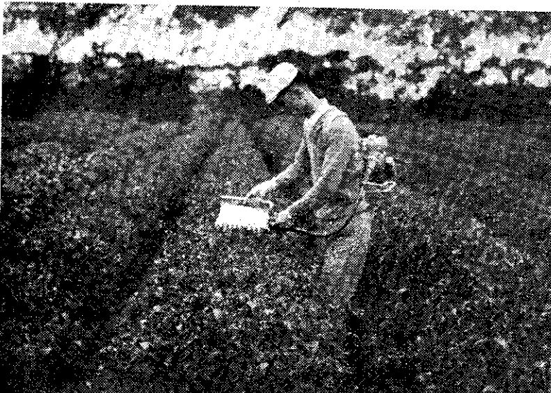
(攝和福呂) 茶剪器機演表，會討檢開場良改葉茶省灣臺

前項分月紙箱及竹篾包裝數量經訂定後，紙箱部份不得以竹篾替代，倘有替代充數情事時，其替代部份不准出口。