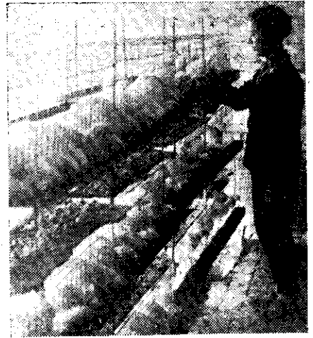
鷄養員會健四校學業職工農級高山