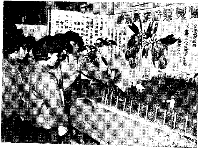
示展育教年會健四

本省四健會工作自民國四十一年開辦迄今已有十六年的歷史，會員數增至八萬多人，他們的工作成績有聲有色，人人皆知，但我們不可以此為滿足，要百尺竿頭更進一步的努力與求改進。