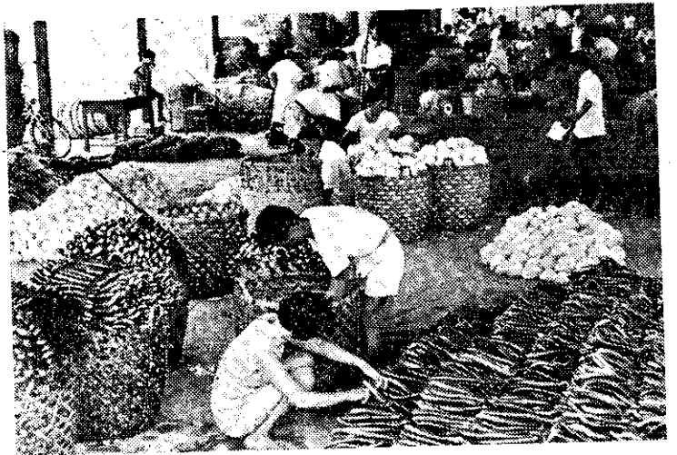
(即吉林)場市發批菜蔬