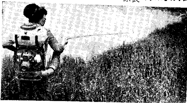
(歡迎賜顧說明書備索)