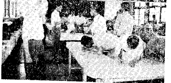
賽競藝技校農省全