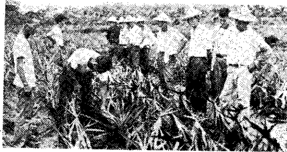
名間觀摩鳳梨示範園(清福)

省農會為明瞭本省土地施用砂酸鈣效果，以便提高水稻、果樹的品質及生產量，特於五十七年指定南投縣名間鄉農會設置鳳梨園施用砂酸鈣示範