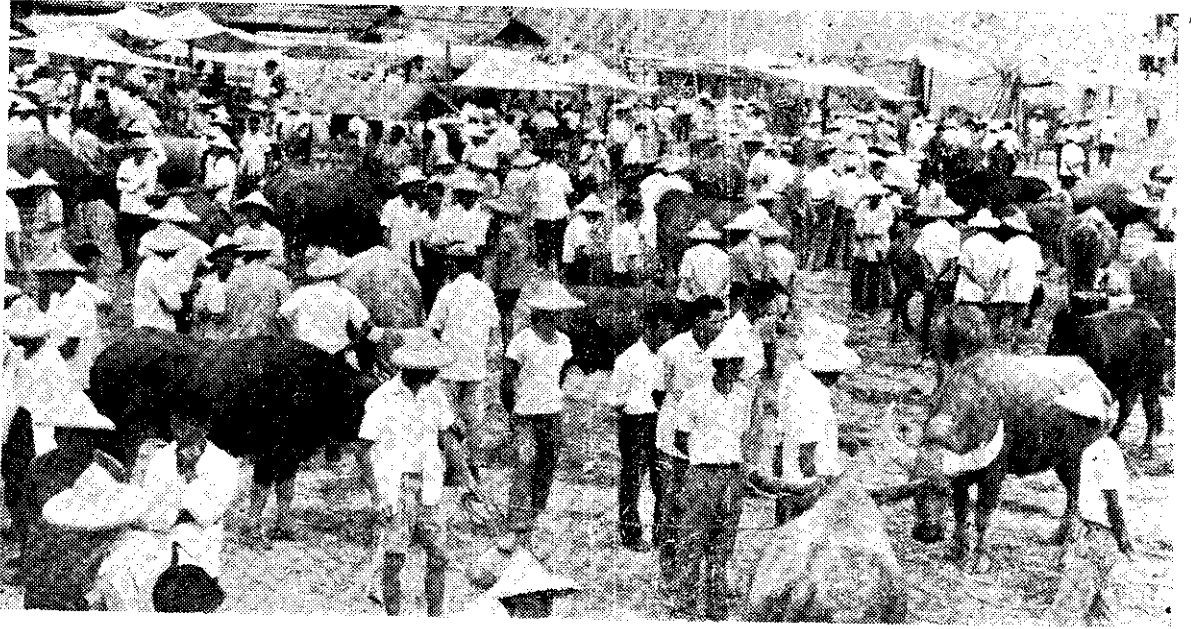
。一第模規省全，場市牛的港北

去參觀。雲林縣北港鎮的牛市場，是本省規模最大的。我對它，一向嚮往慕名已久，最近才有機會