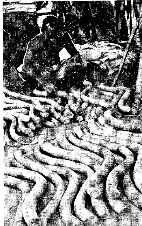
上：製藤的牛轆 下：刺竹裝成的牛轆

(一) 現在的牛價，最好的水牛值一萬五千元，普通的值一萬元，最低的值五千元。黃牛的價格，祇有水牛的一半。 (二) 水牛的體力比黃牛強一倍，但走路的步伐，比黃牛慢一半。 (三) 農民用手伸進牛嘴裏，摩挲牛齒，就可判定牛的年齡。 (四) 測驗牛的體力的簡單方法，是用三輛連結的牛車，車上坐滿人，大家吶喊，叫牛拉動，便可測出牛的體力。 (五) 因在牛市上，還有許多臨時攤販，是賣牛軛（牛擔）、驅牛鞭、牛鈴、牛斗、牛鼻圈、牛口套、