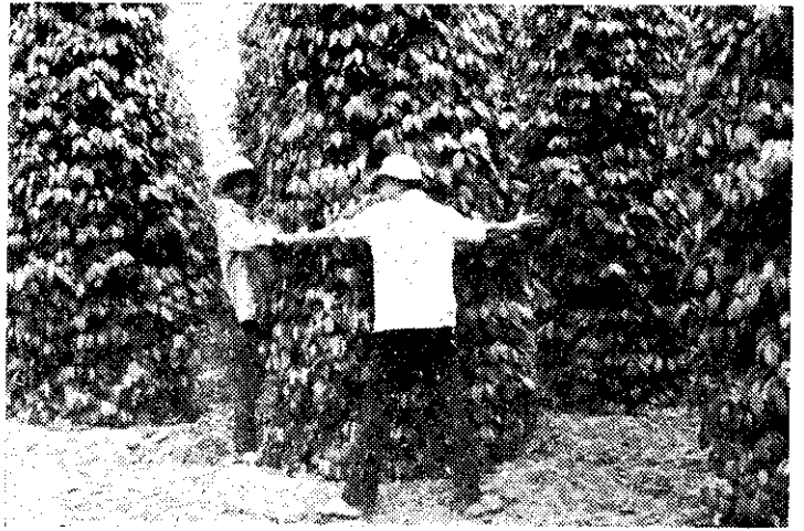
圖合人三——椒胡的好良育生

一成以上呈紅色時，即可採收。八月間開的花，至翌年六月可以開始採收，採收季節持續二個月許。