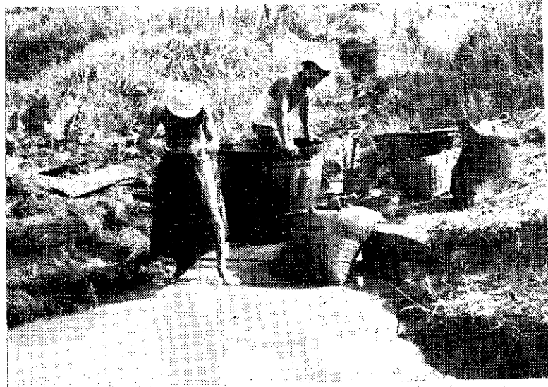
白胡椒製作——脫皮漂洗