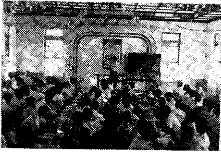
大樹熱帶果樹栽培講習會