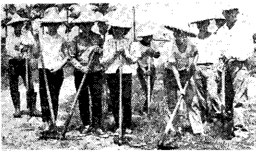
同心協力修築道路(大埔)