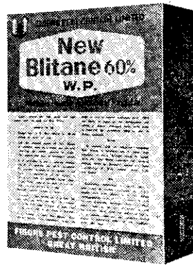
本行進口銷 售包裝匣圖

茲向全省經銷商及農友保證，本行信譽保證所進口之此兩種銅劑製品，係直接向英國訂貨進口，成份充足，效果可靠。如有任何不實疑慮問題，本行絕對責任保證，負責任何賠償要求，特此鄭重宣佈週知，並繼續大量廉價供應農友。