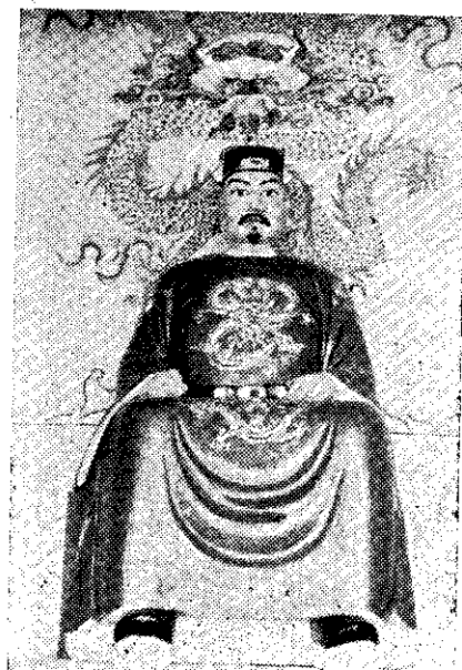
金新門延平郡王廟中聖像

漁業局的措施包括：改善台北縣貢寮鄉福連村馬崗及卯澳的漁民飲水設備；加速完成貢寮鄉福連村卯澳的船澳擴建及在福隆村挖仔新建避風港；在福連村及福隆村設立醫療診