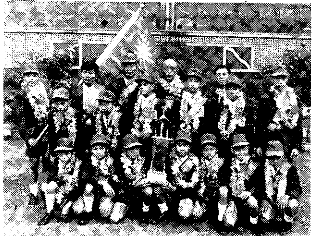
(社共中)。宴功慶加參部樂俱官軍軍三在隊龍金

在這一高潮之後，有心之士已在憂慮後龍的小將們絕大多數因為年齡超過十二歲而無法出賽，因此，要想明年衛冕成功，必需及早打算，臨時抱佛脚是不行的。 也有人樂觀的認為，中華小將這番傑出成就，事實上已使舉國上下體認到全民體育的重要，這是提倡體育風氣的一大契機。因此，也許可以再訓練出與金龍隊一樣好，甚至超過金龍隊的少年棒球隊。 事在人為，我們不必過份憂慮，但是，一味樂觀也不是辦法，重要的是腳踏實地的去做。(崇)