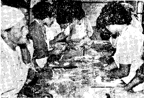
山胞婦女學做麵食（王舜堯）

民國四十年，屏東縣政府在這片荒地上安置了從深山的霧台、三地、馬家三鄉自願遷往此地開墾的山地同胞一批。多年來，他們離開了山地，以堅忍、勤勞的精神，默默地從中墾荒，把磷礫巨大的怪石推置一邊，歷盡千辛萬苦，將怪石砌成矮牆及農道，披星戴月與砂石爭土地，向砂石要糧食，播下了種子、萌芽、生長、開花、而至結實。