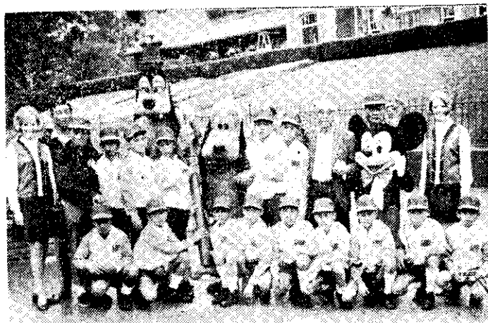
中華少年棒球隊遊美歐斯耐爾團留影(社中)

台灣省教育廳長潘振球，最近在一項記者會上說：本省國民體育運動已經呈現蓬勃的朝氣，教育廳將把握這個機會，加強促進全民體育的發展，並採取六項具體措施，包括：寬籌體育經費，擴建省立體育場設備；增設體育實驗班，加強輔導與集訓，研究分區舉辦國民小學運動會及舉辦體育行政人員特種考試等。