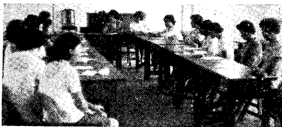
員林婦女討論家庭計劃

文琪面紅耳赤地站起來：「我曉得大家想知道一件事——就是我會不會按照幸福家庭的指示，採用『三、三、三』制，放心吧！」當然全體給與最熱烈掌聲，表示滿意。