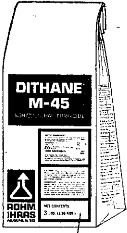
新包裝此方格子較小，字體一行