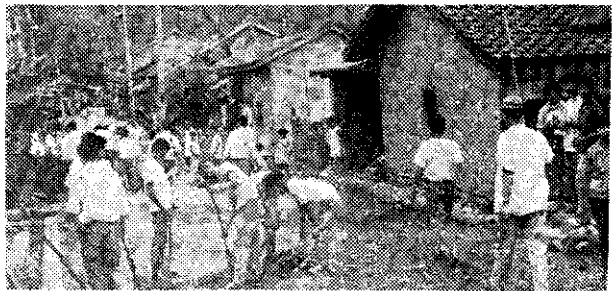
台中會員協助重建災區 (寶光)