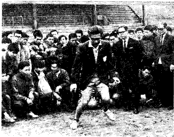
中日橄欖球裁判及教練，在台北舉行講習會。(中央社)

中華女子籃球隊決定自二月十一日起實施第一期的集訓，準備赴韓國參加比賽。中華女籃代表隊教練湯銘