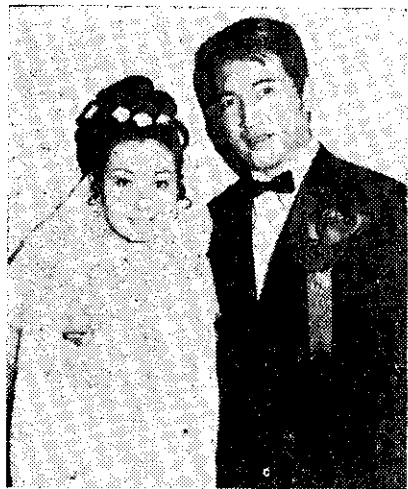
影星柯復雄與張美瑛的結婚 (中央社)

糧食與肥料技術中心計畫。湄公河計畫。亞洲外海區域礦產資源聯合探測計畫。亞洲蔬菜發展中心計畫。土地改革訓練所計畫。中國家庭計畫國際訓練中心計畫。亞洲區域性「金屬工業發展研討會」訓練計畫。聯合國在華舉辦「經濟