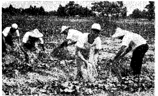
西螺共同作業情形(張璋)

雖然何家為豐原望族，但是何會員及家人均認為門當戶對的時代已經是落伍了，所以並沒有考慮到新娘的家庭環境，而不顧親友的議論予以完婚，因此深受外人的讚譽。(白雲)