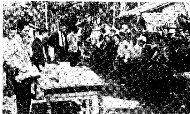
施藥方法與施肥一樣，全量作一次平均施完。施藥

一月底，舉行了第一次稻田殺草劑使用示範觀摩會，到會農友約一千人，農業專家及附近推廣人員多人應邀參加。示範應用的殺草劑「七·七」多谷粒劑，經植物保護護會議委員會審查通過，列入農藥推廣手冊。據主持試驗的吳育郎技正說：「多谷粒劑的藥效，不受溫度及土壤性質的影響