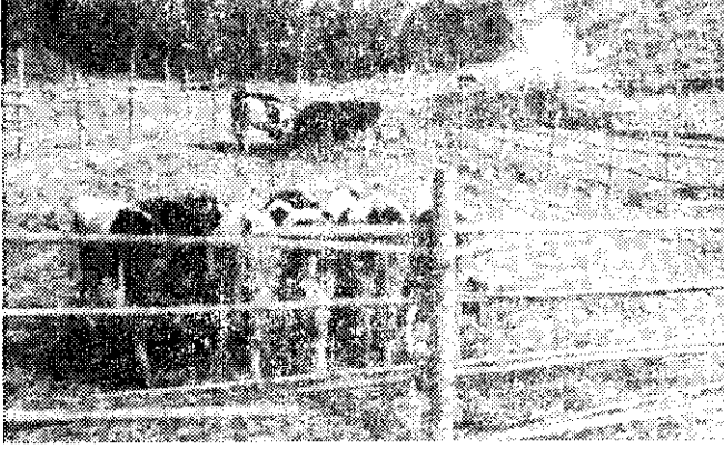
設在台中大甲鎮的示範農場