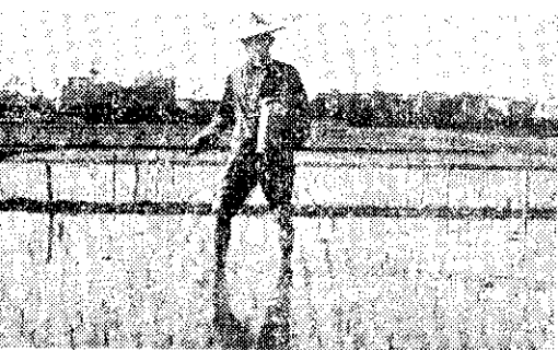
←施用殺草劑省工省時