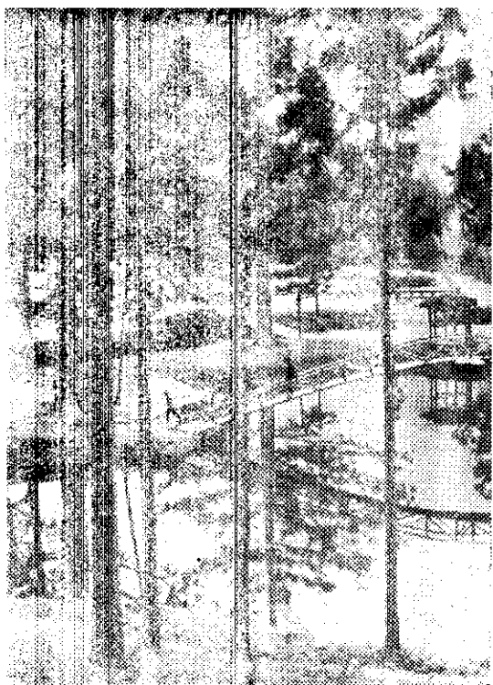
台大圖書館內的池