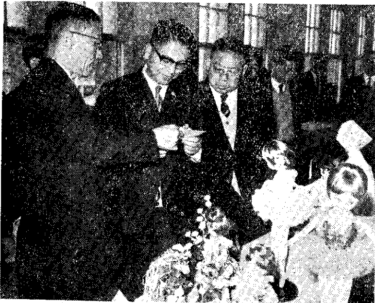
南投鎮農家婦女副業技能玩偶訓練班慶祝結業成果展覽(林吉郎)

養雞生產成本一年比一年降低，同時養雞的利息也一年不如一年，但是養雞有關稅率却一直不變