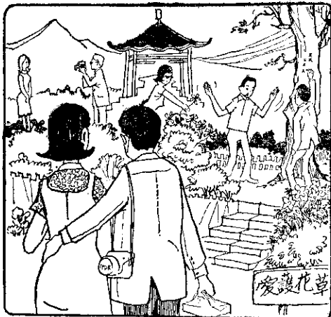
遊覽風景名勝 愛護花木，不隨便攀折 也不刻畫樹皮

小弟天不怕地不怕，除了老師外，就是怕藤條。他慌忘亂翻報紙，無意中翻出那本通書，原來還是父親自己把它壓在報紙下面的。(永信)