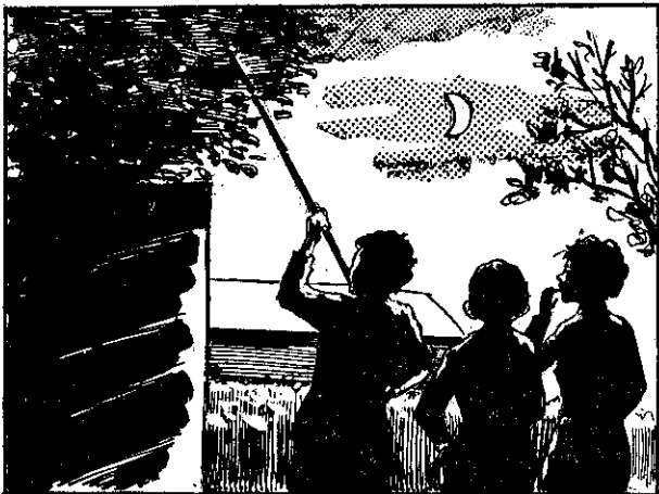
小瑜說：讓我也來顯顯身手！