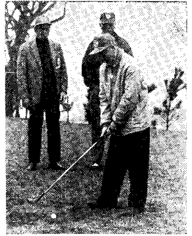
吳三連為高球賽主持揭幕 (中央社)

十二億三千六百萬元，年增加率高達五·六四%，平均每人所得九千五百五十四元，較上年增加二·九二%，足證本省經濟日趨繁榮，人民生活有顯著的改善。