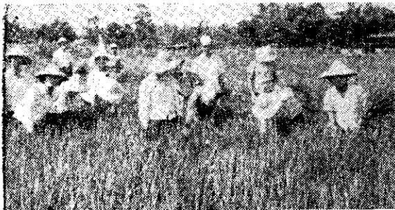
十南埔麻里四健技研情形 (沈榮得)

當夜幕低垂時，我們不得不結束這歡樂時光。看遠方萬家燈火，與長空明月相映成趣，這良辰美景，怎不令人難忘？