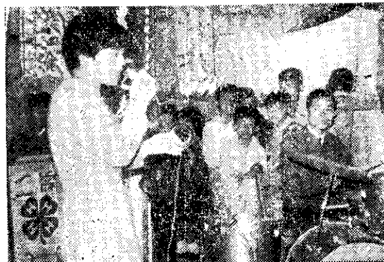
二番湯賢村康樂比賽 (李燕夫)

▼南投縣草屯鎮新豐里四健會，於上(四)月十三日召開農事、家政及四健聯合會議，由該里農事小組長主持。會中除討論有關水稻共同防治及栽培事項外，會後並以幻燈片介紹「插秧機使用方法及荷蘭乳牛事業」，供會員參考。(伯華)