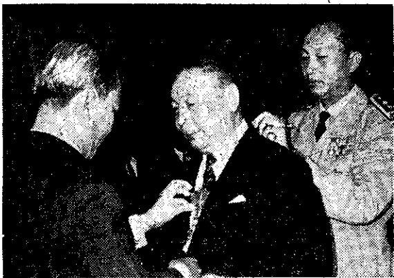
越南總統阮文紹(左)，以一等金質勳章贈予蔣經國副院長。

自己燒死。蔣副院長在越南會晤阮文紹總統致敬，並就國際局勢、亞洲局勢，尤其是柬埔寨變遷後所產生的東南亞的新形勢，交換意見。雙方對各種有關問題的看法，完全相同。蔣副院長認為，此次晤談非常有