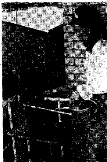
美國公寓住戶的「迷你菜園」

公寓住戶對「迷你菜園」最有興趣。以蛭石、泥煤苔和肥料混合而成的人造土壤，在美國種子行和園藝器材供應店可購到，這種土壤裏沒有病菌和雜草種子，保水力强，質量很輕。(宋曰鏞譯 U.S. Ag. Notes 403)