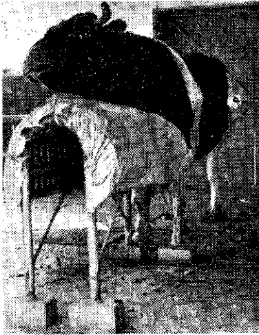
利用假母台採精液

年青的牛，如遇直腸檢查困難時，將手安靜地停止於直腸內，等緊張過去，或把手伸出直腸外，等候擴張過去後再插入直腸內。