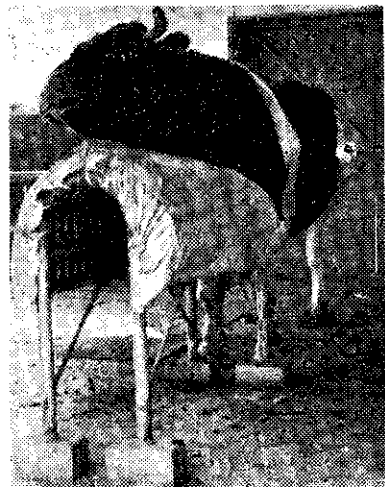
利用假母台採精液

精液注入時一般應注意事項： ①手需清潔，應帶橡皮手套、可洗的前圍皮，及雨鞋等。②注入器需先消毒滅菌。③陰部要清潔，陰部周圍及尾部糞便應先洗好，注入前陰唇時用手移開，不可滲染到