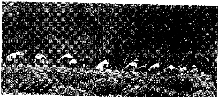
大溪四健採茶比賽(廖明吉)

是夜同樂晚會節目非常精彩，計有禮物交換、歌舞表演，尤其是古坑農會兩位小姐的客串，使晚會倍增光彩。(張金泉)