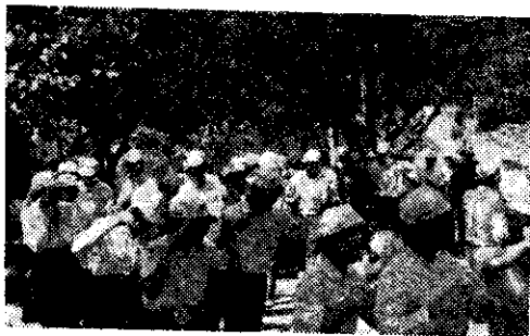
台東四健會露營上風舞表演(鄭國棟)

康樂活動是採用田邊具樂部的方式評分，比賽結果，獲獎單位計有台東鎮(山地舞)、東河鄉(橡皮圈接力)、池上鄉(開牛及合唱)、鹿野鄉(土風舞)、太麻里鄉(樂隊演奏)等。(鄭國棟)