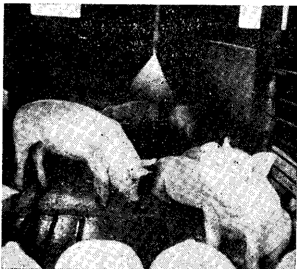
豬用清水噴灑洗滌，可增進舒服。

總之，養豬不妨寵愛，會替養豬農民帶來紅利。(董立摘譯自 U.S. Ag. Notes)