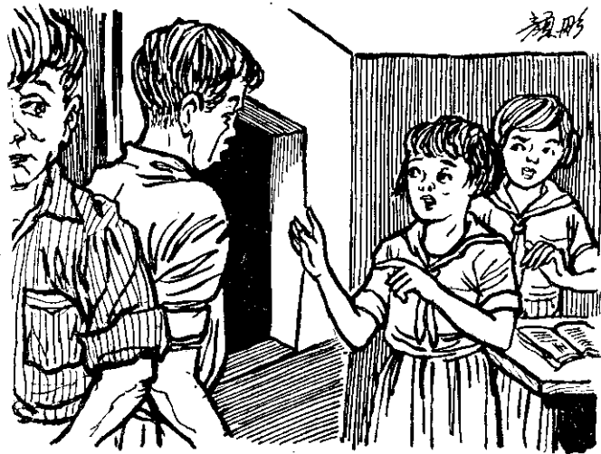
哥哥，是你！怎麼不叫門就進來了？