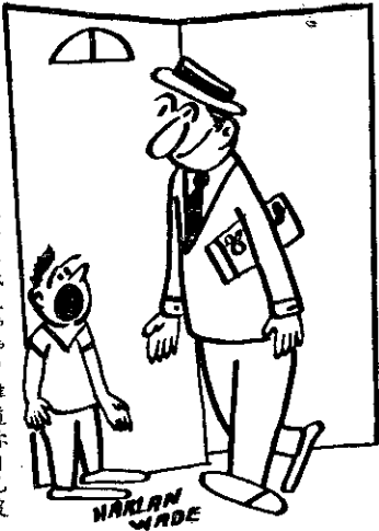
小明：你爲什麼總是要來找我坤坤？難道你自己沒有坤坤嗎？