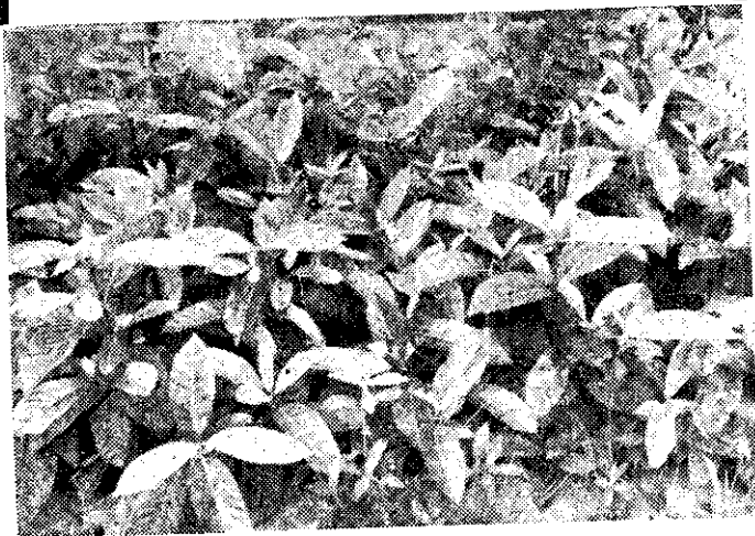
黃梔子三年生扦插苗