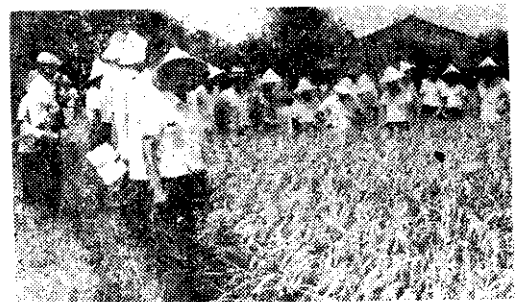
竹北鄉舉辦優良水產品展示展覽會(林邪賞)