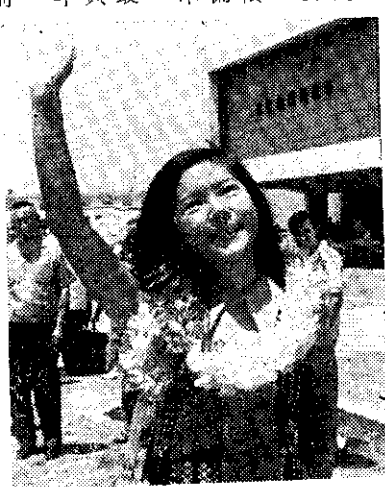
歌星趙曉君赴香港演唱

點也不。因爲自從她一九三九年嫁給農夫之子沙洛以來，家裏幾乎年年添丁。結婚那年她一六歲，她丈夫一七歲。子女羣中健在的有一四人，最大的已三〇歲，其中六人已婚，婚後也都人丁旺盛。