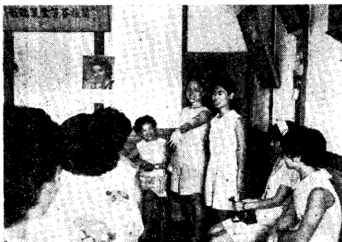
來自美國的沙那西小姐，參加竹山鎮家政討論會（廖春生）