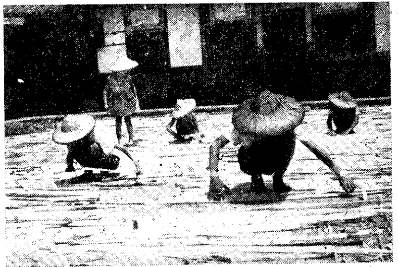
二水地區蕉農曝曬香蕉絲

常少數的蕉農拒絕合作，效果就大打折扣。一株病株發生，蕉農起碼損失四〇元，如果全省有〇·三%罹病率（這可說病率很低了）每年就要損失七千萬元。發現病株，隨時處理，病源減少，傳染機會就大為減低，病源撲滅，自然無病可傳，這是惟一的防治捷徑。 希望全體蕉農們，尤其是台中地區的蕉農們，應通力合作，趕快撲滅香蕉萎縮病。