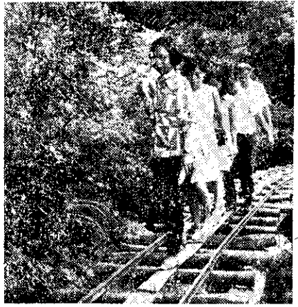
豐原鎮四健會北部旅行暢遊烏來山道時留影(張弘遠)