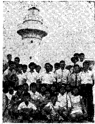
第七鎮四健會南部觀摩旅行時在恒春塔塔前留影(鄭瑞信)

苗栗縣五十九年度農業推廣教育露營活動，於八月廿七日起三天，在頭屋國中操場舉行。各項活動成績評定如下： 展開檢查——(一)後龍、(二)公