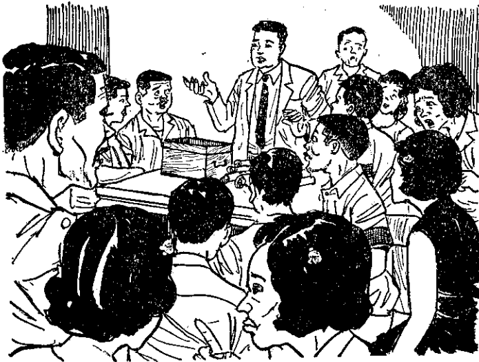
阿爸才死了幾天，你們就等不及，想分家過活了嗎？

老四說：「不行，臨時那裏去找買主？而且田地變賣成錢，坐吃山空，沒有好久就吃光了。我認為