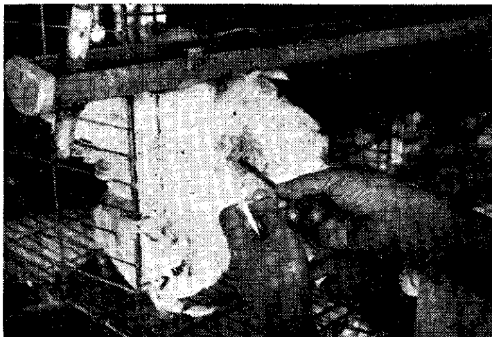
授精步驟之二：注入精液

授精器是小注射筒，頸部很長。先將授精器的頸部放入精液中，抽出○●○三到○●○五CC的精液，並且用手指頭固定活塞以免再抽入空氣。如果授精時注入空氣，精液就會溢出陰道而影響授精效果。使用現有的授精器，可以很容易的將頸部插入一寸左右，這時將活塞壓下，注入精液就完成了。授精完成後，助手只需將母雞放開，母雞就會自己跑進雞籠。授精的時間最好在下午一點鐘以後。每個禮拜做一或兩次就可以。每禮拜做兩次的結果要比做一次的成績好，第一次授精以後在第三天就可以開始採取種蛋孵化。