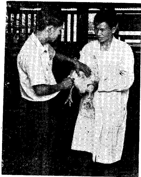
採精步驟之一：捉雞與按摩

時最理想的是放在乾熱滅菌器內，但若沒有這種設備，只好放在沒有灰塵而通風的地點，使它風乾。