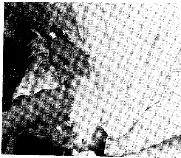
採精步驟之二：擠精

按摩時有兩種方法，筆者常用的是，由兩人操作，助手用雙手捉住公雞雙腿(手掌輕握大腿基